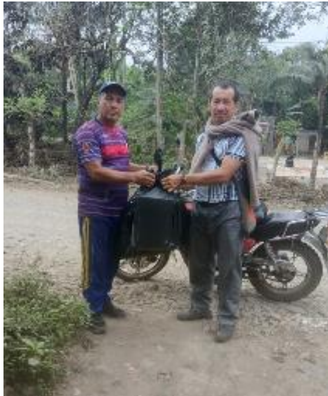
Agasajo navideño en la repotenciación del parque “Juan Carlos García Intriago”