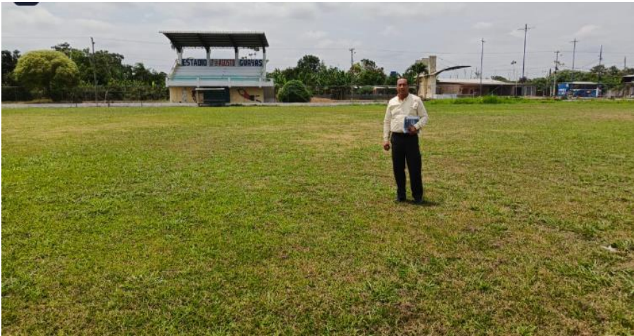
Fiscalización de obra reconstrucción de parque central “Juan Carlos García”