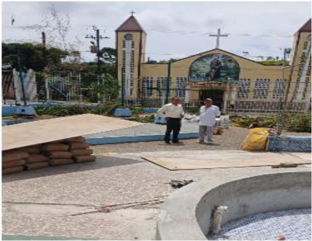
Constatación del avance de la obra “reconstrucción del parque Juan Carlos García”