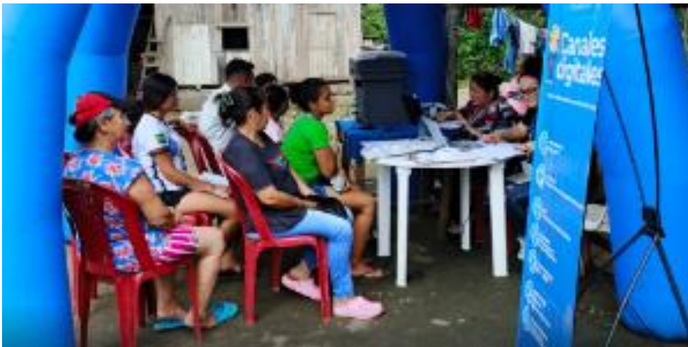
Socialización con moradores para la postura de los medidores