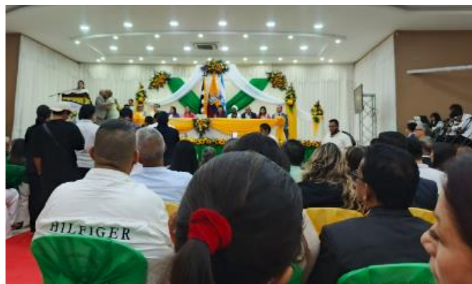
Participación en Unción Cívica por aniversario del Cantón