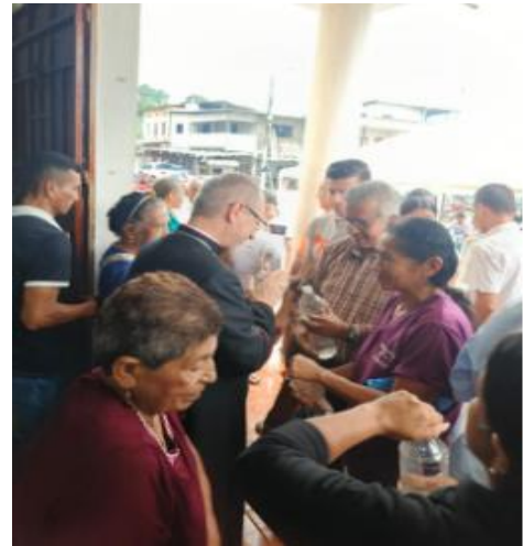
Participación en Acto de Juramento de Bandera de la Unidad Educativa Pueblo Nuevo