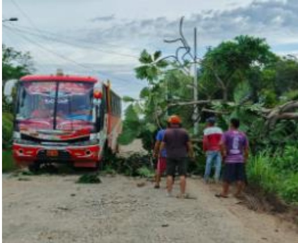
Coordinación para limpieza de árboles para la templadas de cables, para la colocación de postes