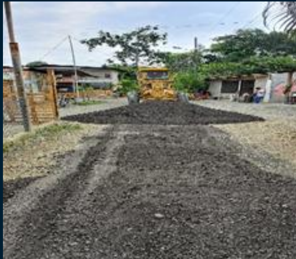
RCTO. SAN JACINTO SECTOR "SAN ANDRES"