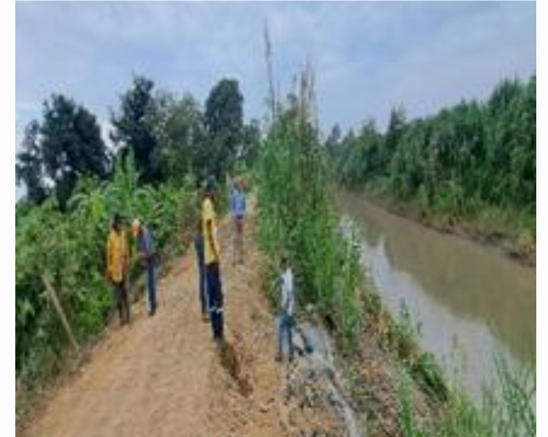
RECINTO EL PARAISO "SECTOR GALARZA"