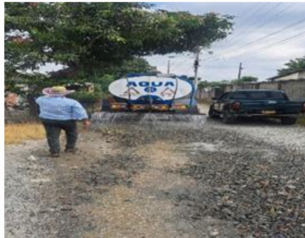
DESDE EL RCTO. REINA DE LOS CIELOS HASTA EL RCTO. LAS PALMAS