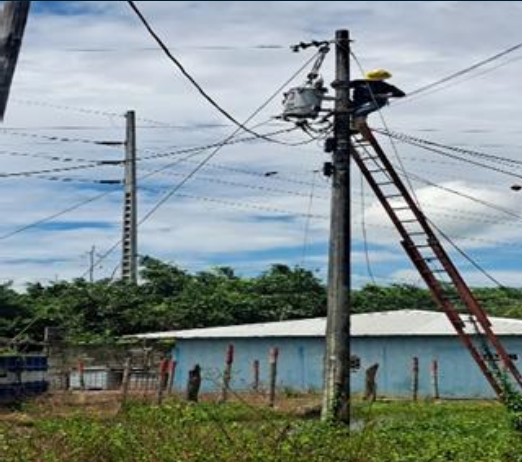
RCT. LAS PALMAS 3