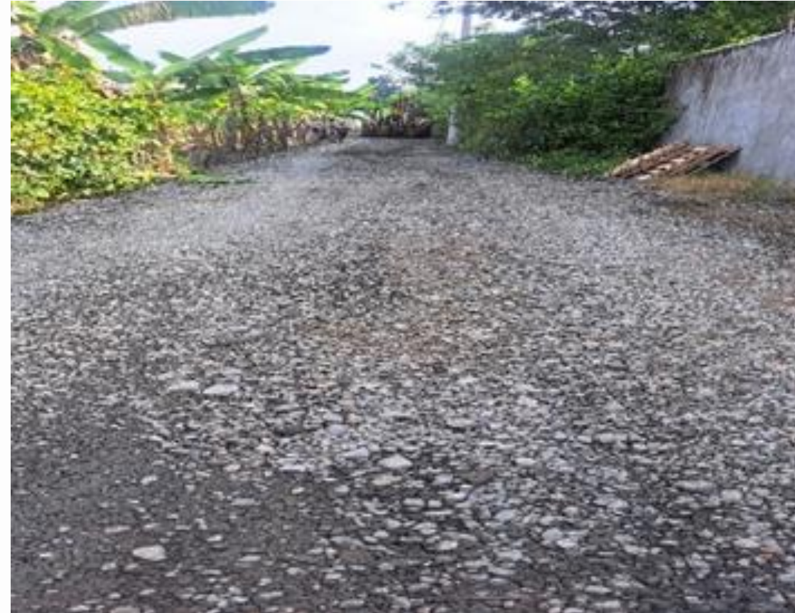
RCTO. SAN JACINTO "SECTOR KM 25"