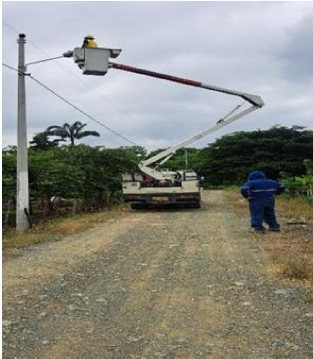
COOPERATIVA 10 DE ENERO